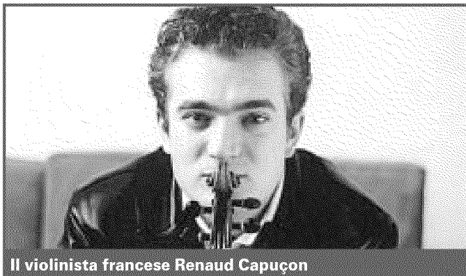
Il violinista francese Renaud Capuçon